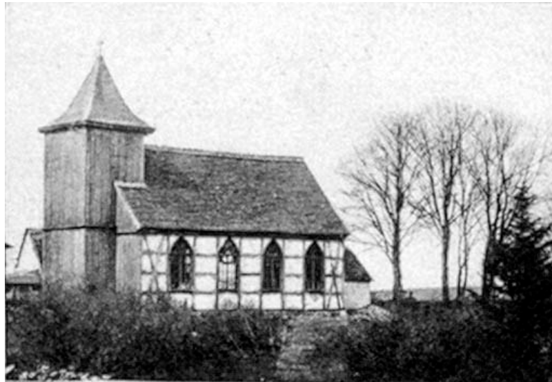
Die Kirche von Hölkwiese kurz nach 1900

Die erste Kirche von Hölkwiese wurde vermutlich kurz nach der Ortsgründung Anfang des 17. Jahrhunderts errichtet. Im 19. Jahrhundert häuften sich die Klagen über ihren schlechten Zustand. In seinem Bericht im Gemeindegottesdienst vom September 1937 beschreibt Pastor J. Dieben, was damals geschah: